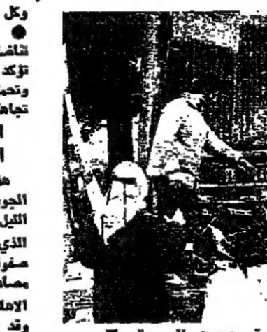
محل احرق بكابله تجاه حرسه مرجعيون الرسمية

اتجاه الى السليية هذا ، وقد ادى سوء الاحوال الجوية في المنطقة ، خاصة خلال الليل ، الى تعيد الوضع الصحي الذي يشهده التارزون ، خاصة في صفوف الاطفال والسنين . وتقول مصادر اللجنة الاعلامية المتتقة عن الاهالي ، ان عملية الانتظار ان تطول وقد تقتر خضوات سليية خلال الـ ٤٨ ساعة المقبلة ، اذا لم تستمر الاتصالات التي تجري مع المسؤولين المدنيين والمسكرين عن حصول مقبولة .